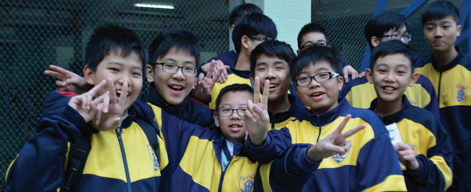
澳门坊众学校的青少年道德赋能项目的参加者们