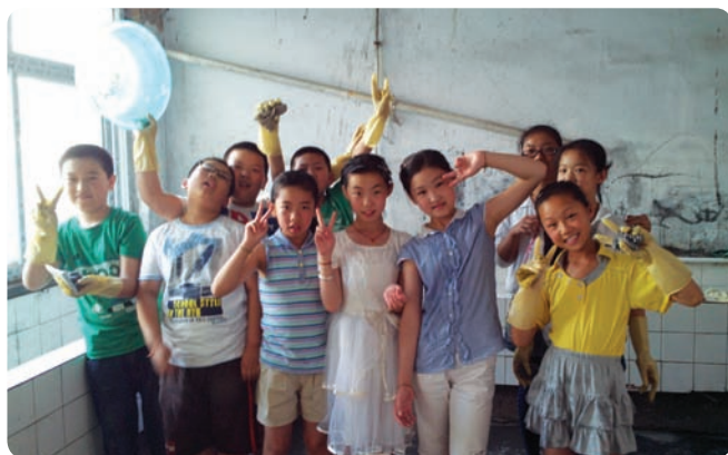
青少年在周末开展清洁水房的服务活动

随着项目的发展，巴迪基金会也和我们一起探讨在当地注册成为民办非企业的可能性，我们也去拜访当地