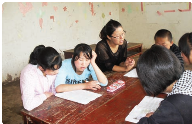
甘肃省临洮县可贝特文化发展中心（项目小组）