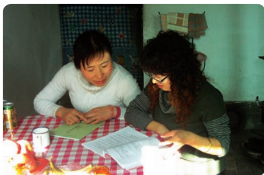
陕西省定边县宇君服务中心（项目小组）

环境建设项目 致力于通过建设农村妇女的能力并释放她们身上蕴藏的巨大潜能为社区的可持续发展做出贡献，基层社区组织和项目小组与农村妇女一起合作，协助她们认识到自己的潜能并推进社区繁荣、和谐以及持续地发展。这一项目在帮助参加者理解农业生产科学知识的重要性的同时，也协助她们获得信心、学习态度、有效磋商与合作的技能以及集体决策的能力，在这一过程中逐渐发展出社区民众的统一行动以促进繁荣与发展。截至2013年年底，与巴迪基金会合作的7个基层社区组织和项目小组在云南、河北、甘肃、宁夏和陕西5个省份开展了环境建设项目。另外2013年年底我们也培训了6个新的人力资源将成立5个基层社区项目小组。