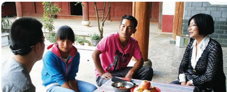
云南丽江索路青少年英语培训中心的协助者在家访