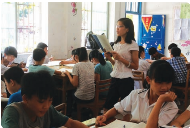
广西壮族自治区南宁伙伴社（项目小组）