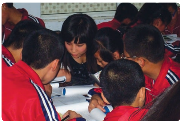
山西省晋城市阳城县旅程青少年发展中心（项目小组）