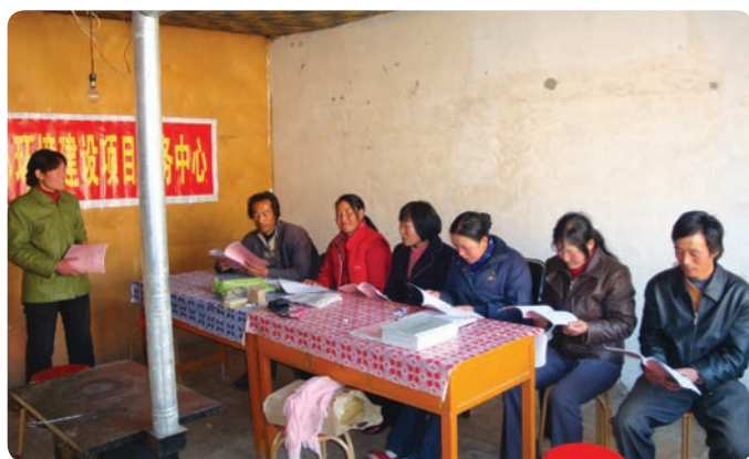
宁夏回族自治区海原县爱心环境建设服务中心（民办非企业）

环境建设项目 致力于通过建设农村妇女的能力并释放她们身上蕴藏的巨大潜能为社区的可持续发展做出贡献，基层社区组织和项目小组与农村妇女一起合作，协助她们认识到自己的潜能并推进社区繁荣、和谐以及持续地发展。这一项目在帮助参加者理解农业生产科学知识的重要性的同时，也协助她们获得信心、学习态度、有效磋商与合作的技能以及集体决策的能力，在这一过程中逐渐发展出社区民众的统一行动以促进繁荣与发展。截至2013年年底，与巴迪基金会合作的7个基层社区组织和项目小组在云南、河北、甘肃、宁夏和陕西5个省份开展了环境建设项目。另外2013年年底我们也培训了6个新的人力资源将成立5个基层社区项目小组。