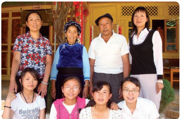
云南省大理市明惠教育信息咨询有限公司 (商业注册)

青少年道德赋能与英语教育项目 旨在提升12-15岁农村青少年的能力以服务当地社区，同时这个项目以英语教学为载体提高他们的英语语言表达能力。这个年龄段非常特殊，已经不再是儿童但是还没有成长成为成年人。在这一时期，青少年开始以一种身体和智力上全新的方式发展，他们开始思考他们的未来，这一阶段形成的信念和习惯将伴随他们一生。在这个特殊阶段，青少年需要被教育以确保他们对道德概念的深刻理解，指导他们选择高贵和正确的生活态度，并提升他们的能力为当地社区服务。目前与巴迪基金会合作的20个基层社区组织和项目小组在10个省份正在开展道德赋能与英语教育项目。