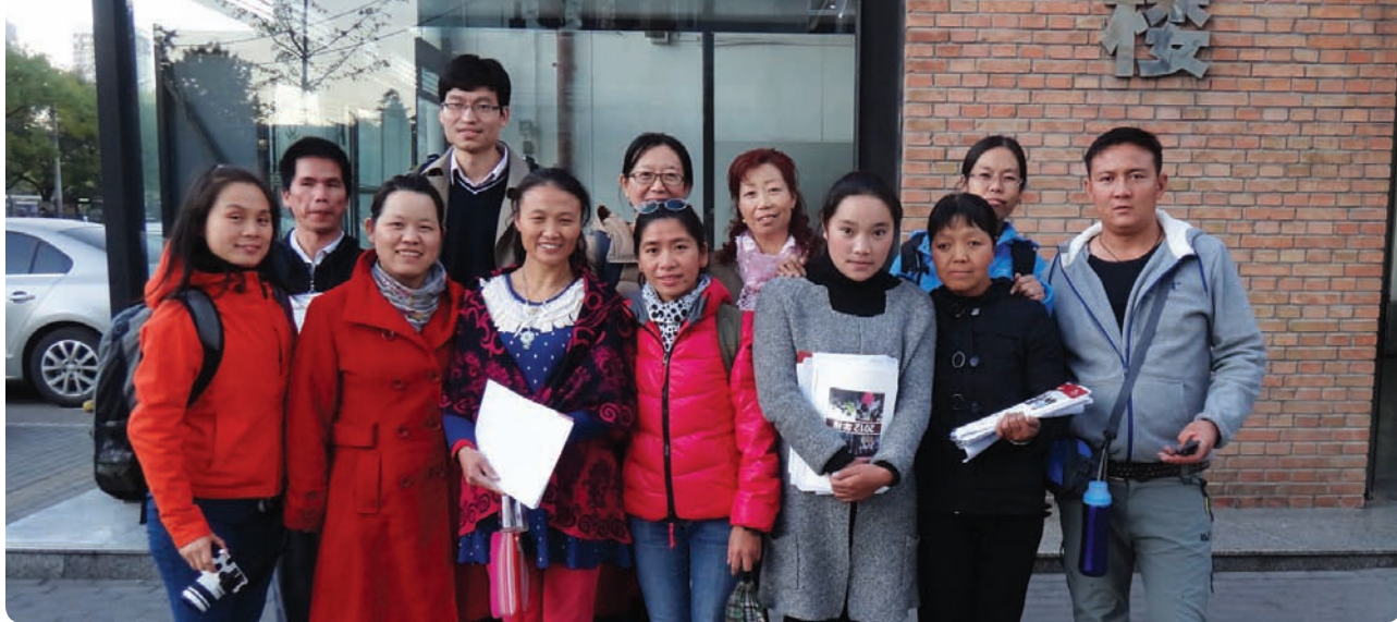
6个机构能力建设项目的潜在人力资源在北京参加研讨会