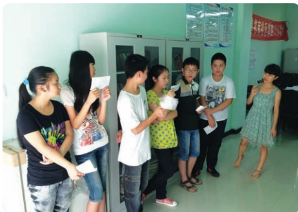
四川省成都市目光赋能教育咨询有限公司（商业注册）