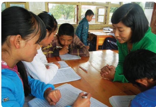
云南省丽江市古城区索路青少年英语培训中心（民办非企业）