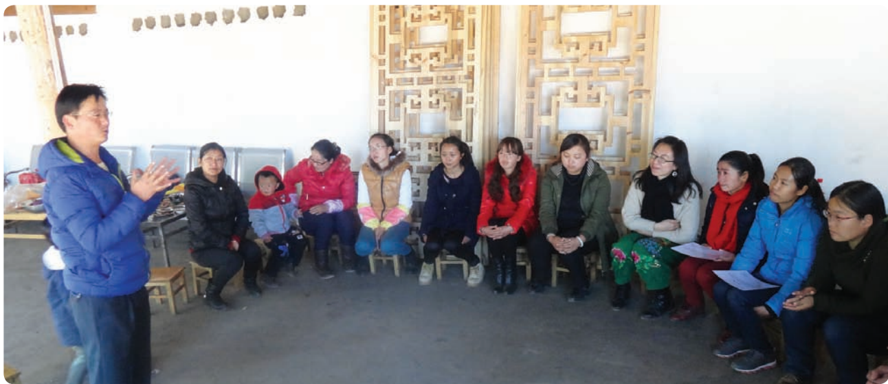
云南丽江合和家园的创始人和机构能力建设项目的潜在人力资源分享项目经验

积极寻求当地政府的建议与支持以及合作关系，这其中包括当地民政局、扶贫办、教育局、市（县、乡、村）政府以及妇联和团委。与地方政府发展与建立机构间的合作关系也是未来几年巴迪基金会希望学习的议题。另外，巴迪基金会也提供给这些基层社区组织与社会经济发展领域内相关的国家政府机构、公民社会组织以及学术领域开展探讨与交流的机会。2013年1月，在北京举办的研讨会上，有3个基层社区组织与国务院扶贫办外资项目管理中心、中国国际民间组织合作促进会、中华慈善总会以及清华大学NGO研究所等不同领域的机构开展了交流与探讨。