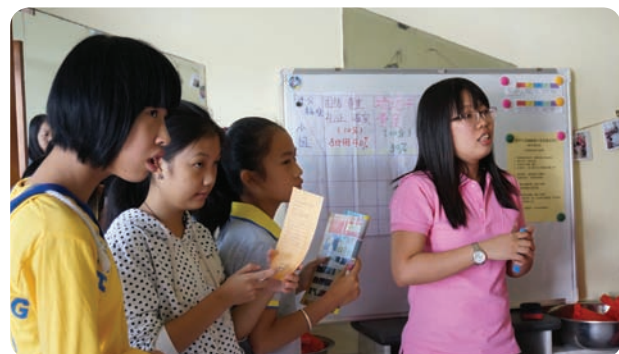
广东省潮州市草帽青少年道德赋能及英语教育 (项目小组)