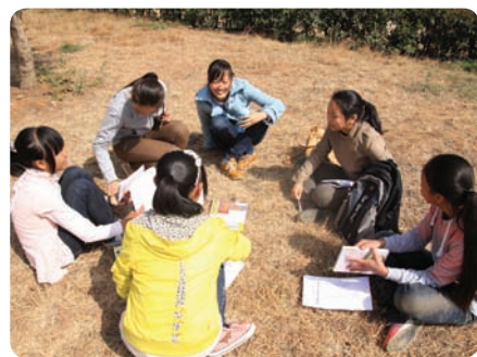
云南大理明惠中心的项目协助者和青少年一起学习