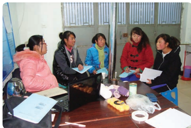
宁夏回族自治区西吉县普润生态环境建设服务中心（民办非企业）