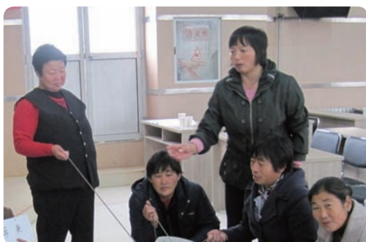
河北省武邑县欣苗社区服务中心（民办非企业）