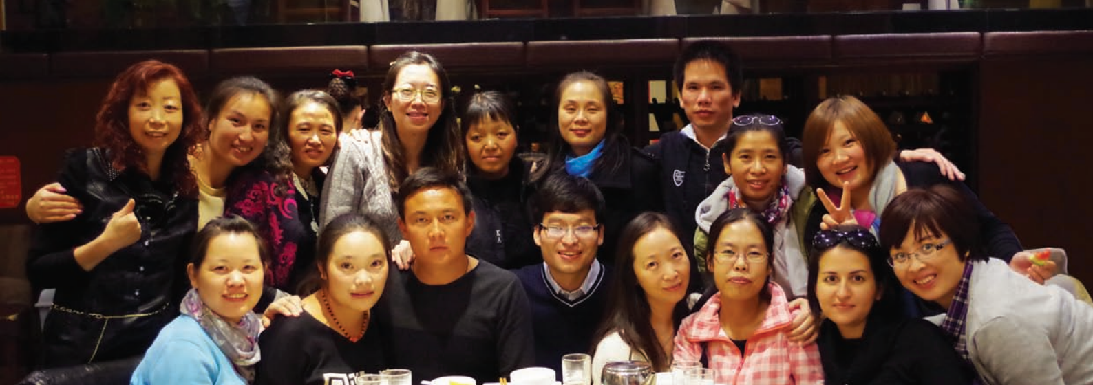
巴迪基金会成员和基层社区项目小组创建人们在一起