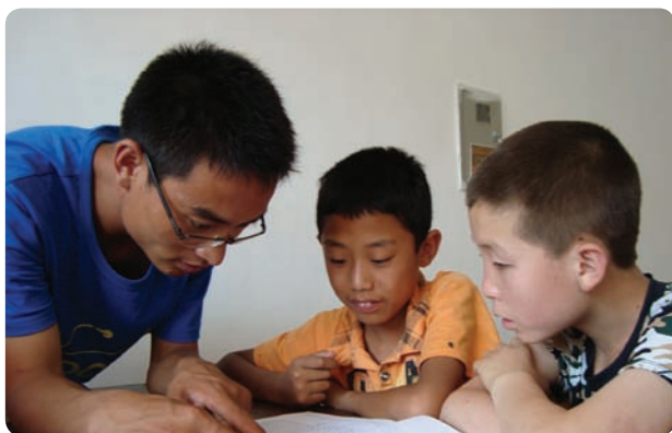
宁夏回族自治区西吉县明达学塾（项目小组）