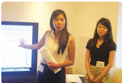
与益启慈善合作开展捐赠工作坊

注释：上面呈递的未经审计的财务报表所记录的巴迪基金会的财政年度为2013年1月1日至2013年12月31日。