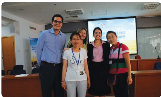
宁夏和陕西的基层社区组织成员和巴迪基金会的职员们在一起

最后，我们也借此机会向在这一学习和发展进程中通过不同方式与我们合作的志愿者、捐赠者以及支持者表达我们最诚挚的感谢！我们希望在下一年度继续与你们携手行走在这一共同学习和服务的道路上！