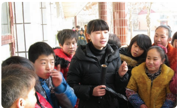
山西临汾可幻外事学院青少年道德赋能与英语教育项目（项目小组）