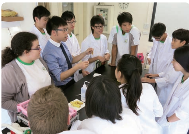
澳门联合国学校的青少年们在磋商如何开展服务活动