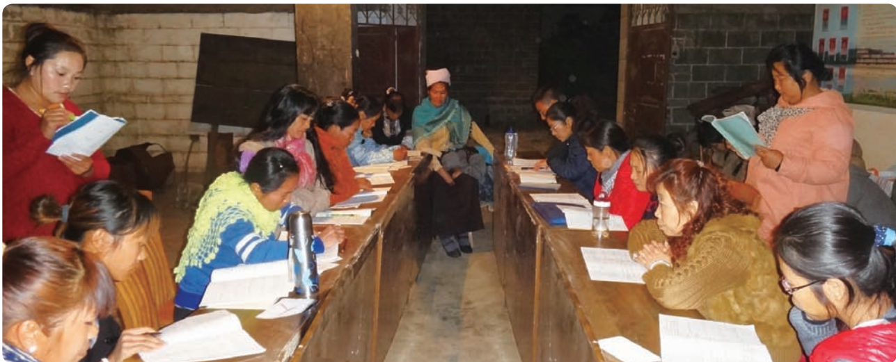
机构能力建设项目潜在人力资源在云南盈江环境建设项目小组进行实地观察和学习