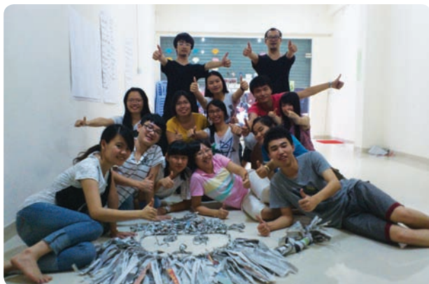
广东省汕头市澄海区乐生源教育咨询有限公司 (商业注册)