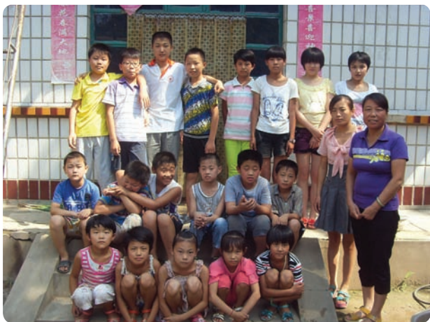
河北省衡水市璞光文化艺术咨询有限公司（商业注册）