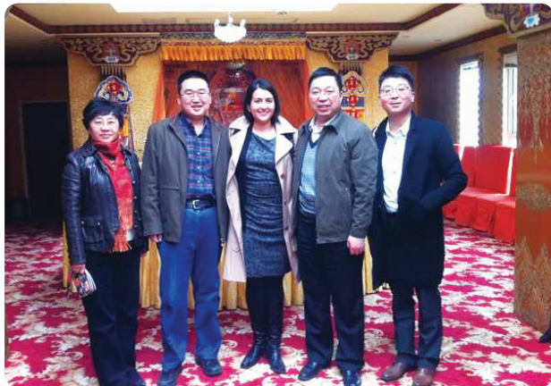
与民促会继续合作开展能力建设培训