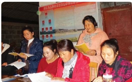
云南省盈江县盈馨和谐社区服务中心（项目小组）