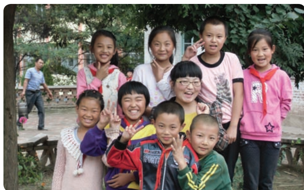
甘肃省兰州市风信子英语学习中心 (项目小组)

青少年道德赋能与英语教育项目 旨在提升12-15岁农村青少年的能力以服务当地社区，同时这个项目以英语教学为载体提高他们的英语语言表达能力。这个年龄段非常特殊，已经不再是儿童但是还没有成长成为成年人。在这一时期，青少年开始以一种身体和智力上全新的方式发展，他们开始思考他们的未来，这一阶段形成的信念和习惯将伴随他们一生。在这个特殊阶段，青少年需要被教育以确保他们对道德概念的深刻理解，指导他们选择高贵和正确的生活态度，并提升他们的能力为当地社区服务。目前与巴迪基金会合作的20个基层社区组织和项目小组在10个省份正在开展道德赋能与英语教育项目。