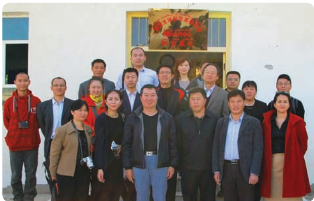
受邀参加国家发改委国合中心组织的新疆和田青年扶贫考察团