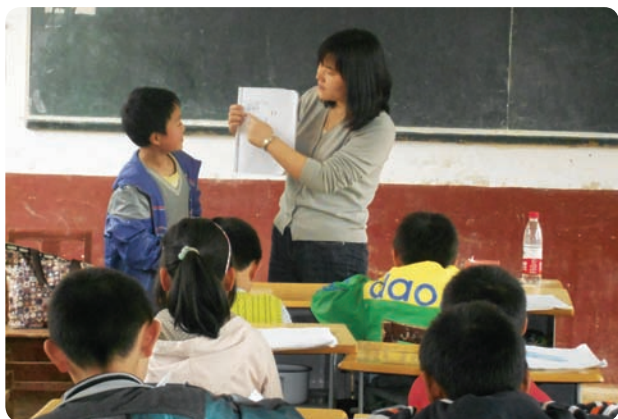
湖南省岳阳市日出社会服务发展中心（项目小组）