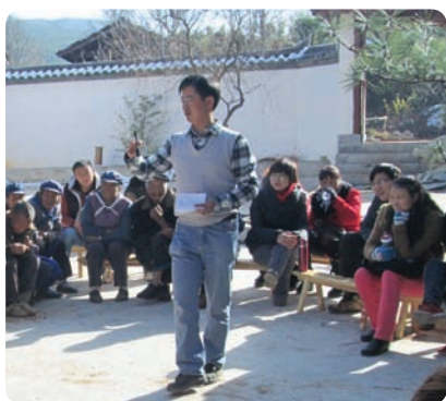
云南省丽江市古城区合和家园社区学习服务中心（民办非企业）