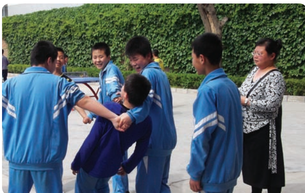
甘肃省天水市青少年赋能发展中心 (民办非企业)