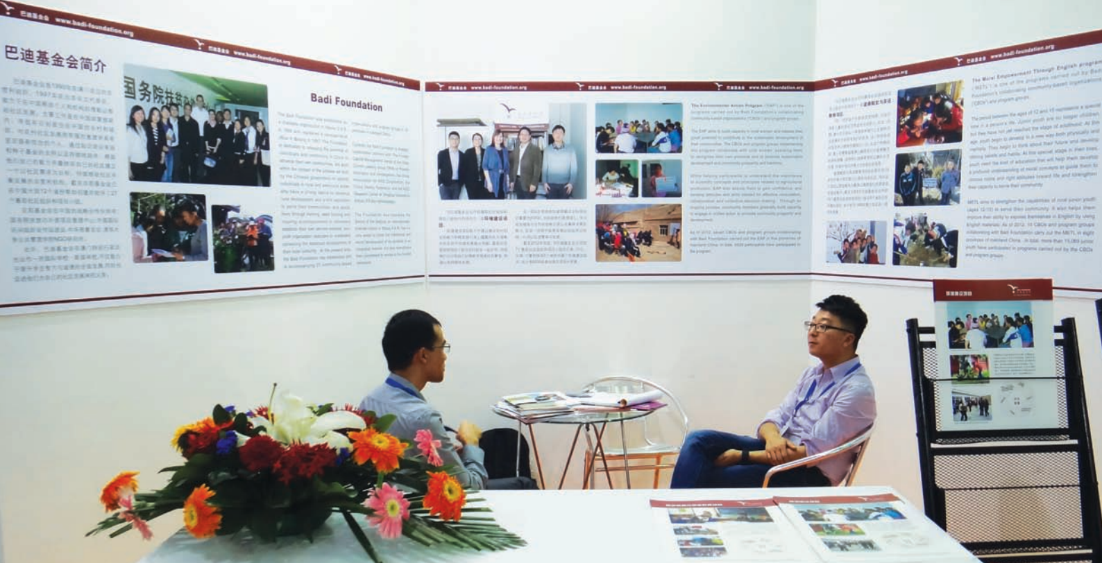
巴迪基金会在第二届中国公益慈善项目交流展示会上分享项目经验