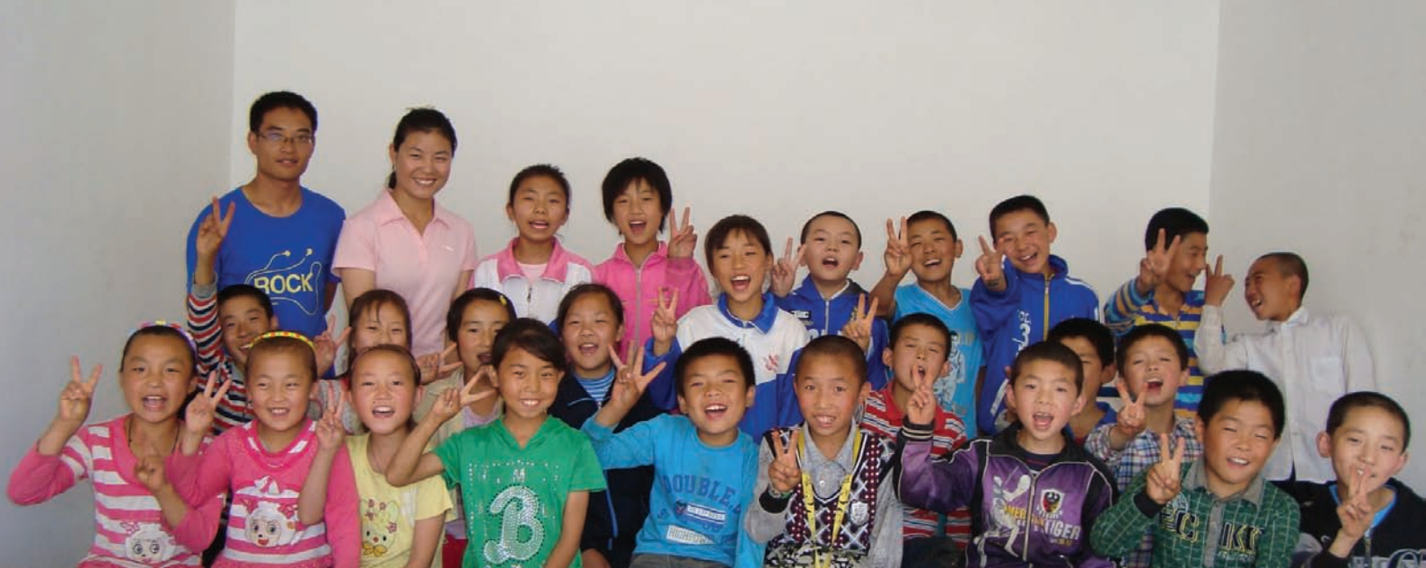
宁夏西吉明达学塾的机构成员和青少年们在一起