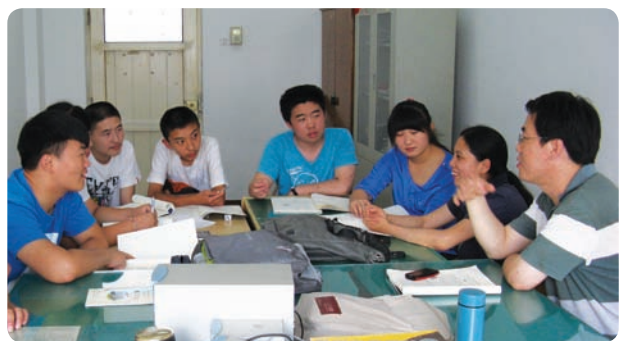
山东省潍坊市德济青少年道德赋能及英语教育机构 (项目小组)