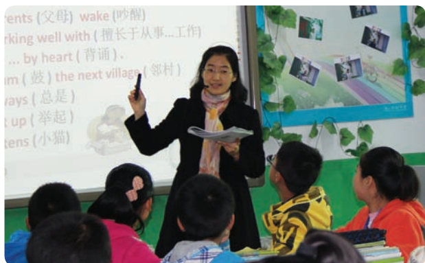
山西省晋城市新园青少年道德赋能与英语学习中心 (项目小组)