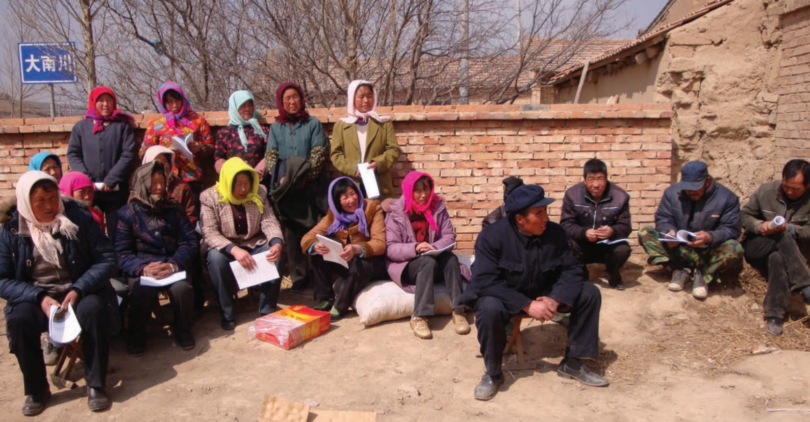
宁夏海原县爱心环境建设服务中心的项目参加者们正在村庄里一起学习