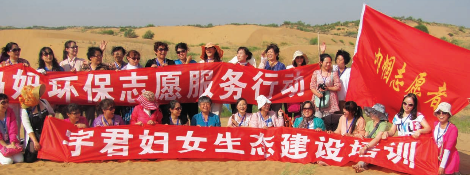
陕西定边宇君服务中心的项目参加者自发组织的环保活动