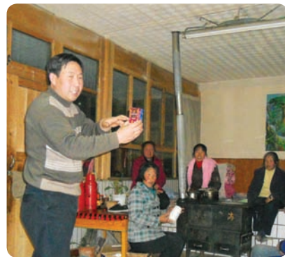
甘肃省古浪县田园乡村文化学习中心（项目小组）