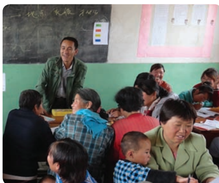
宁夏西吉县清源和谐社区服务中心(民办非企业)