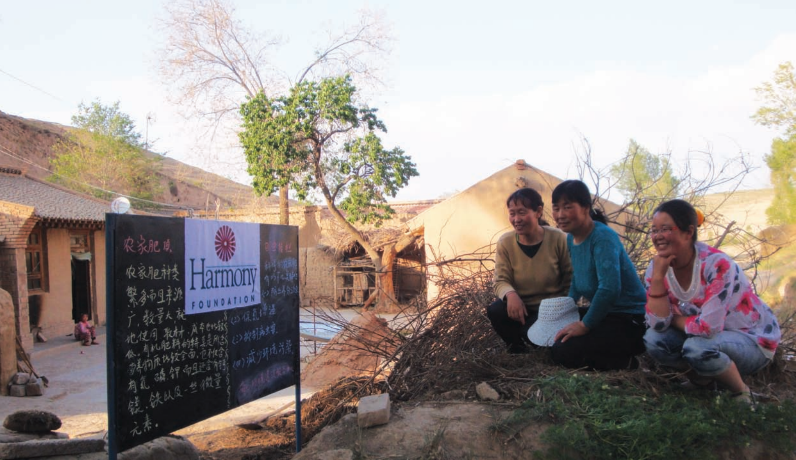
宁夏海原县爱心环境建设服务中心的项目参加者集体磋商应用科学知识并主动申请到赠款开展了农家肥项目