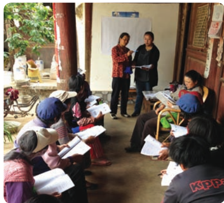
云南丽江合和家园的项目协助者和村民一起学习