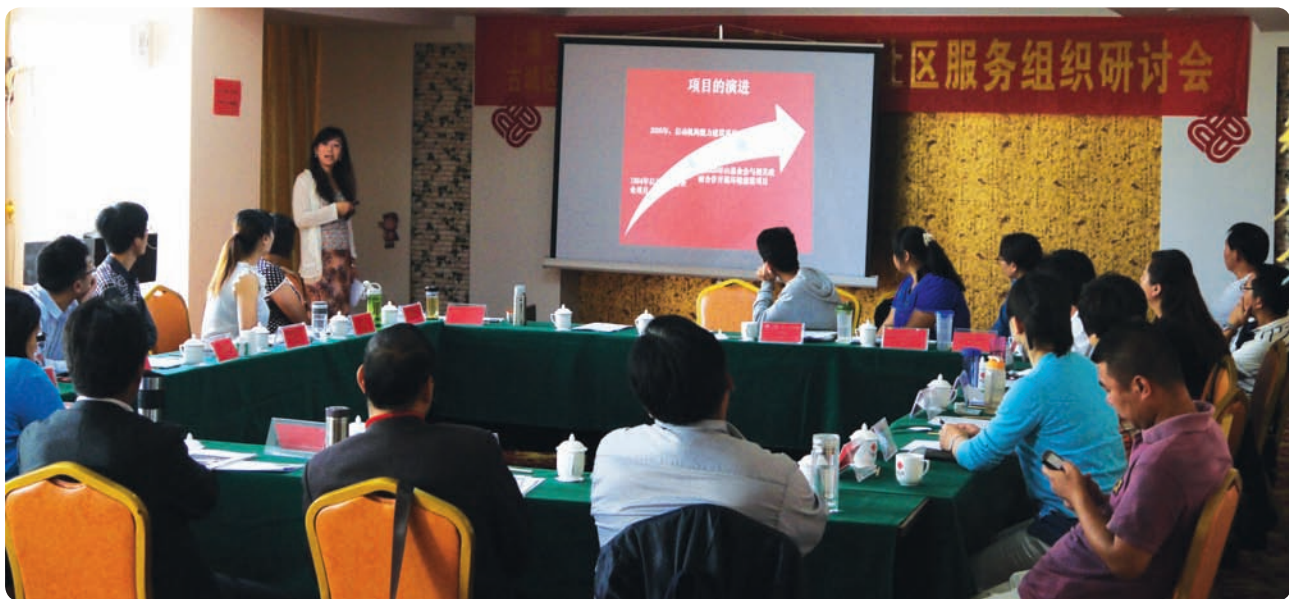
巴迪基金会职员在云南举办的研讨会上和7个环境建设项目基层社区组织分享项目概念框架