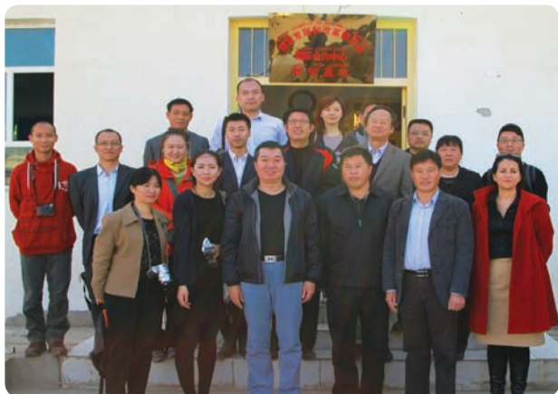
受邀参加国家发改委国合中心组织的新疆和田青年扶贫考察团