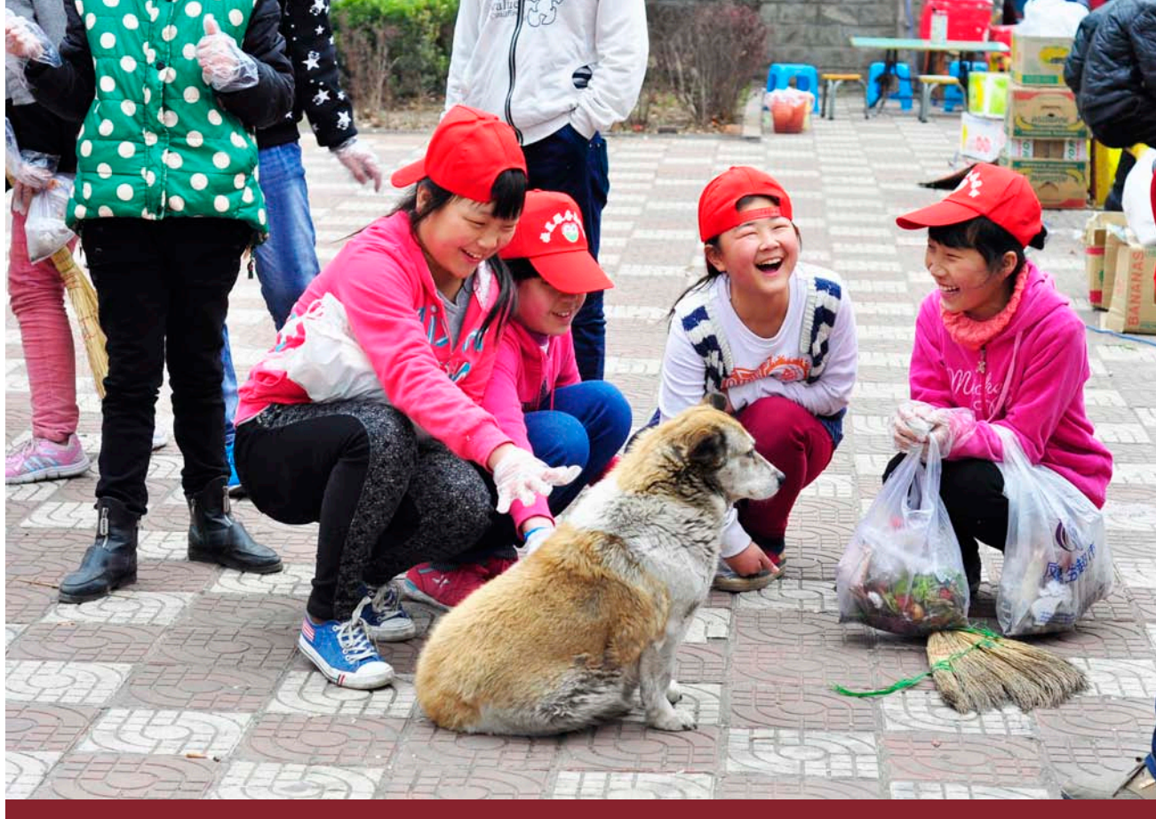
山西泽州新园青少年赋能发展中心的项目参加者主动开展社区清理活动

30个基层社区组织和项目小组开展的能力建设项目也在进一步发展中：13个针对农村妇女的环境建设项目的基层社区组织和项目小组继续在8个省稳步开展，这一年他们与30个社区合作，1044人参与到项目中并覆盖到5983名社区人群，至此环境建设项目已经覆盖到15625人。在项目质量方面，我们发现参加者已经开始有意识自发组织和参与越来越多的社区服务活动，同时在某些地区，农村女性们已经开始尝试了可持续农业经济发展项目，可喜的是这些经济项目都是从小起步而且村民们开始思考使经济获益覆盖到社区大众。17个针对青少年的道德赋能与英语教育项目的基层社区组织和项目小组2015年继续在9个省开展项目，与62个基层社区和学校合作，有2541人参与到项目中并覆盖到6591名社区人群，至此道德赋能与英语教育项目已覆盖到33545人。在这些社区或学校，青少年已经开始主动参与到社区的服务活动中并逐渐开展了更为持续的社区和校园服务活动，并对促进当地社区发展的议题更为关注，同时也带动了家长以及老师也参与到项目中。另外，根据英语老师的反馈，学生的英语表达能力普遍通过该项目有了显著提升。