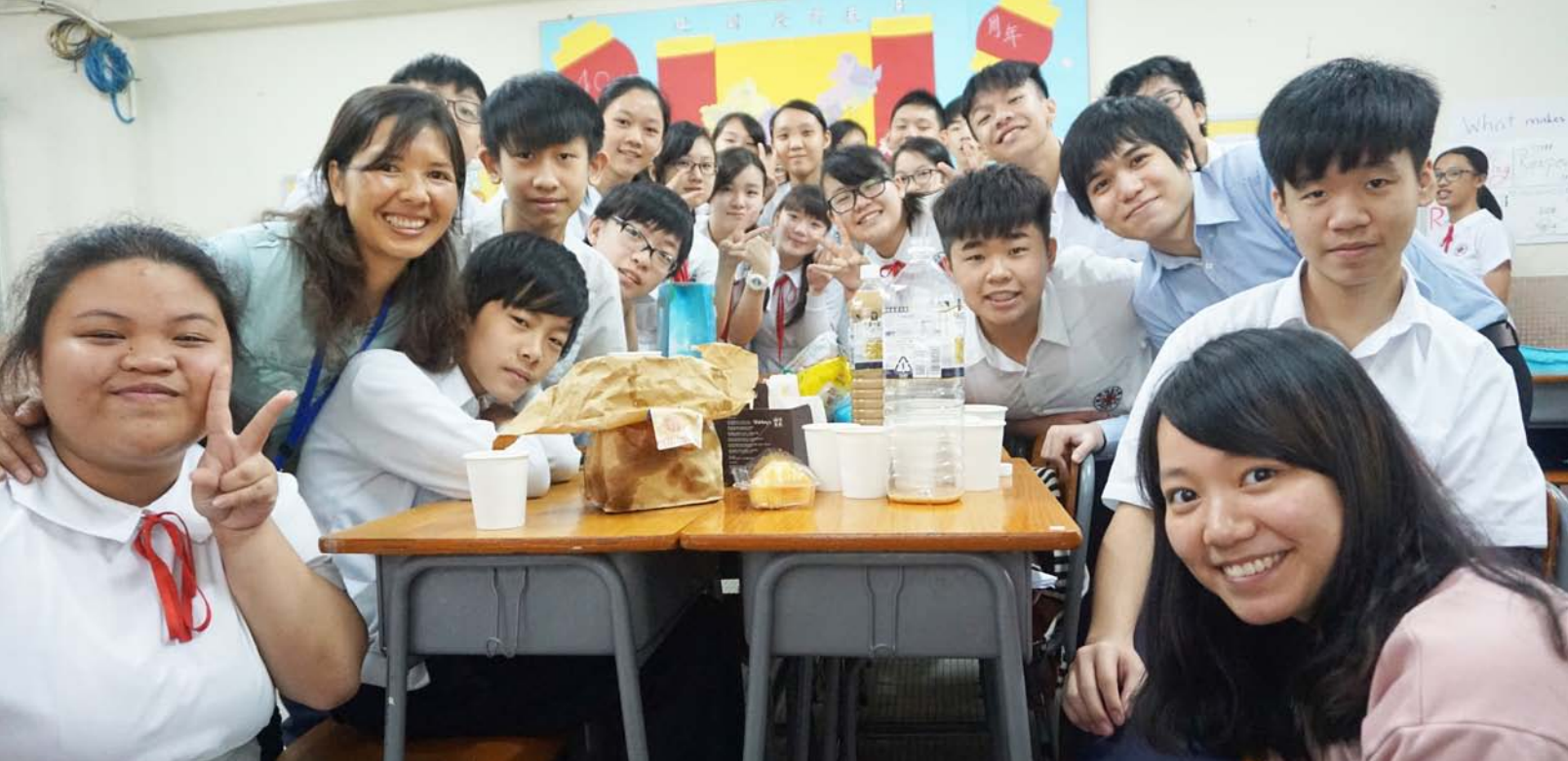
在澳门培道中学初二B班进行的道德赋能项目