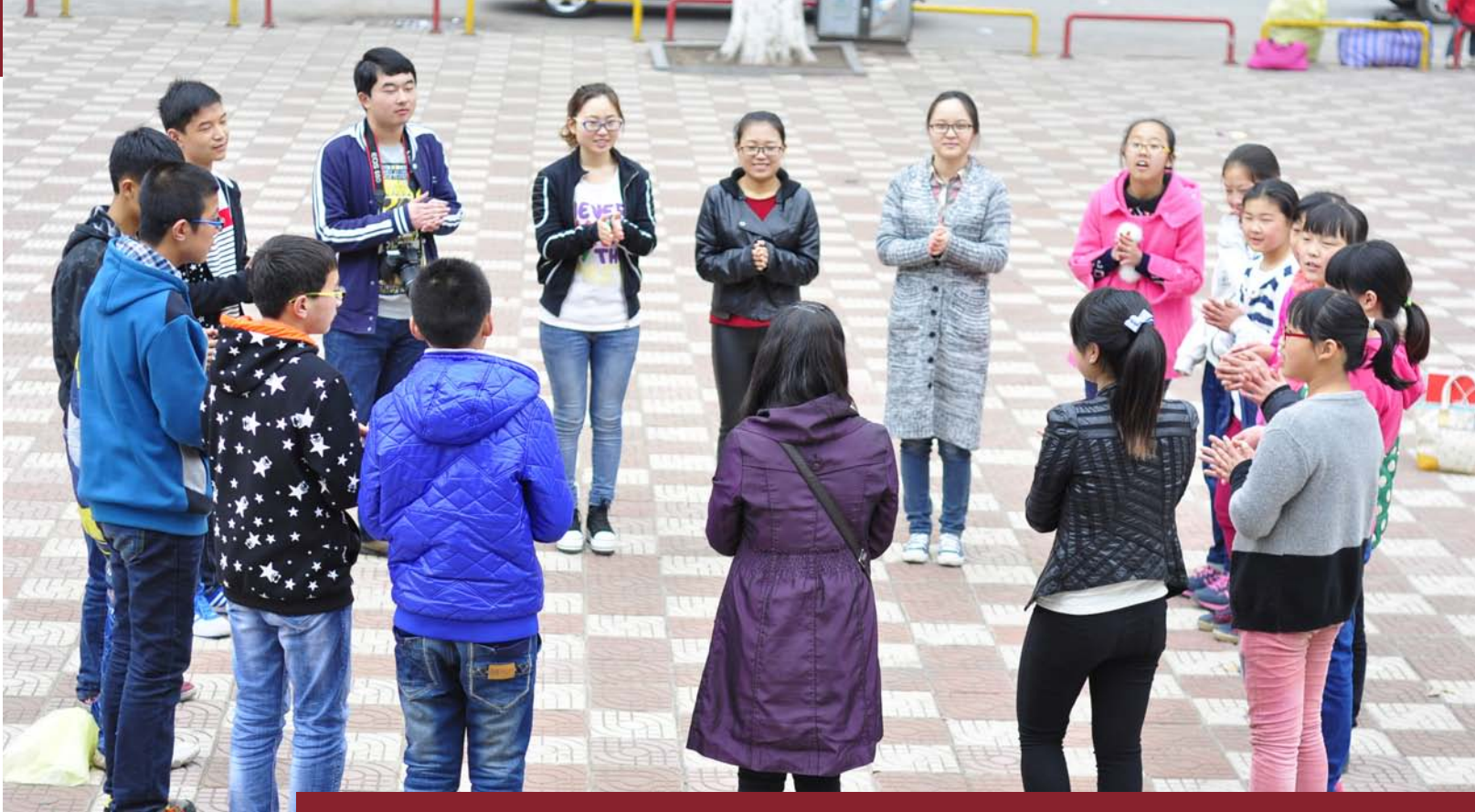
山西泽州新园青少年赋能发展中心的激励者和青少年们一起学习教材中的歌曲

在山西晋城，我们看到这一机构在成立三年时间内的迅速发展，这一机构的发展进程给了我们特别丰富的反思机会，青少年已经在项目的材料与活动的影响中逐渐主动识别社区的不同需求并付诸行动，而机构在这一发展进程中应用了项目中家访，艺术活动，反思会等不同元素陪伴青少年将简单的社区服务活动向更加复杂化的程度推进，青少年们已经不仅仅只是开展清扫社区等简单的服务活动，而是应用视频，海报等不同的途径和村民分享戒酒以及公共健康等知识。