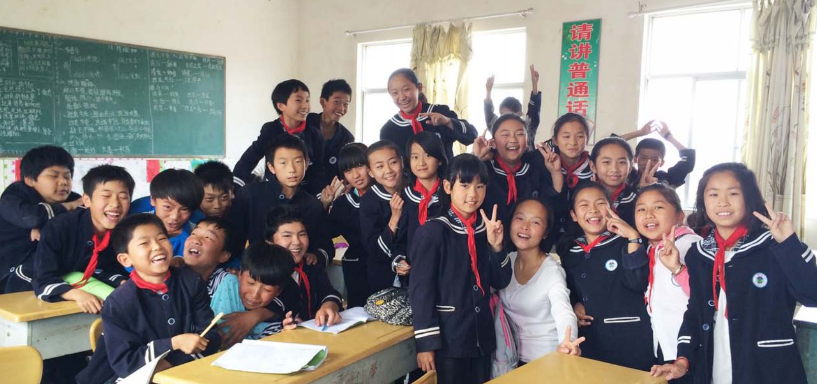
云南弥渡沙漠绿洲青少年文化发展中心激励者和青少年们在一起