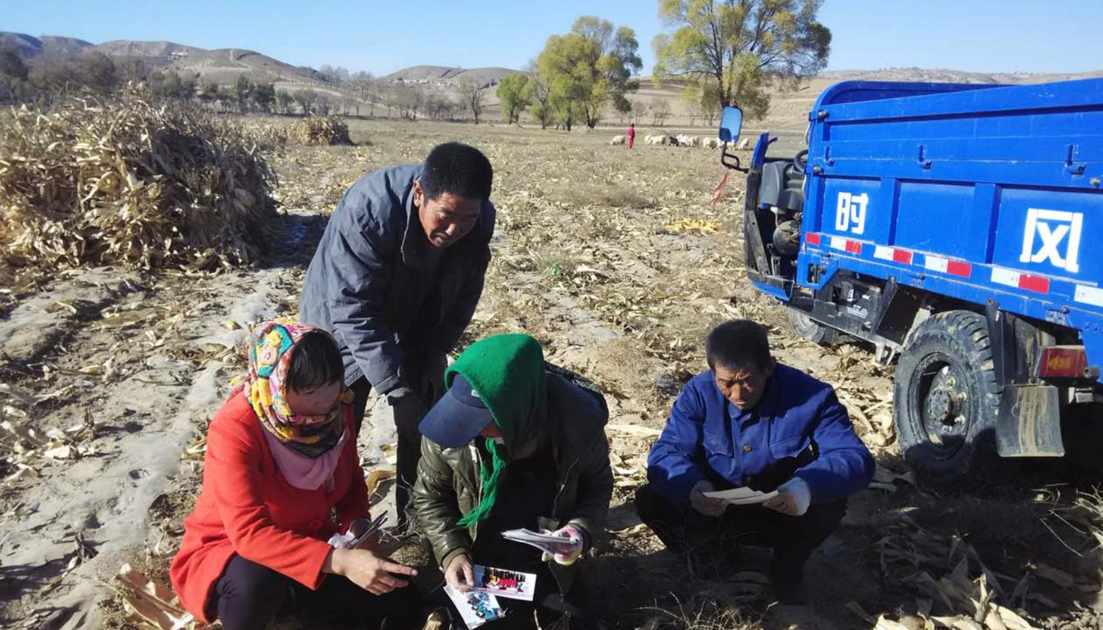
陕西定边宇君和谐社区服务中心的项目协助者开展社区回访活动