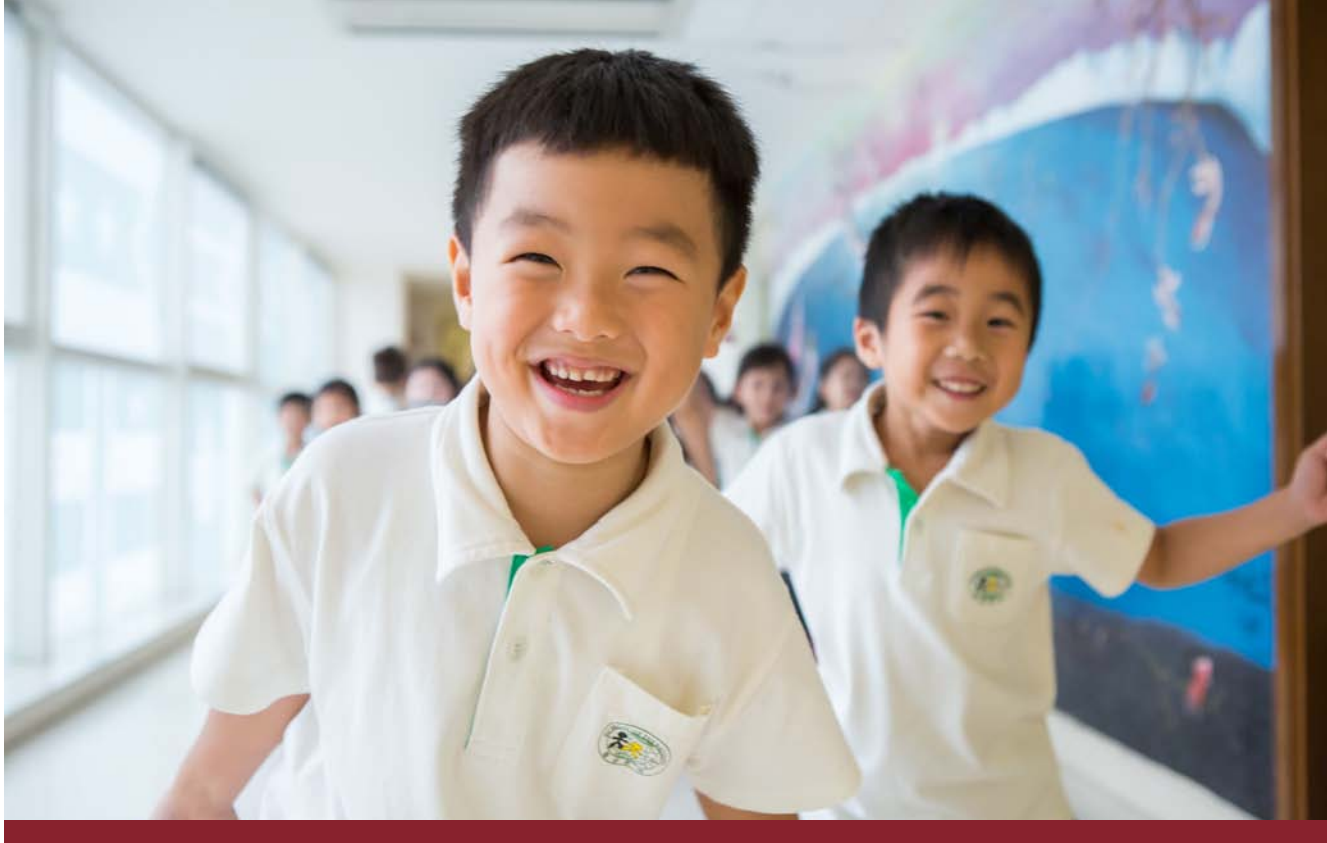
联合国学校幼稚园的小朋友们