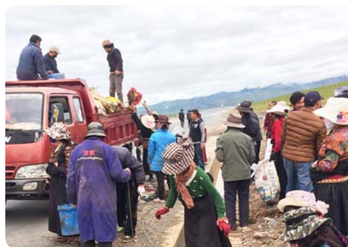
青海玉树的项目参加者们自发开展草原环境保护活动

基层组织能力的有机发展一直是我们最核心的工作之一，2015年我们欣喜的看到不同组织在不同阶段相应能力的提升。我们期望在这一陪伴和学习进程中，这些机构所实现的进步在社区发展的层面具有永久的价值。