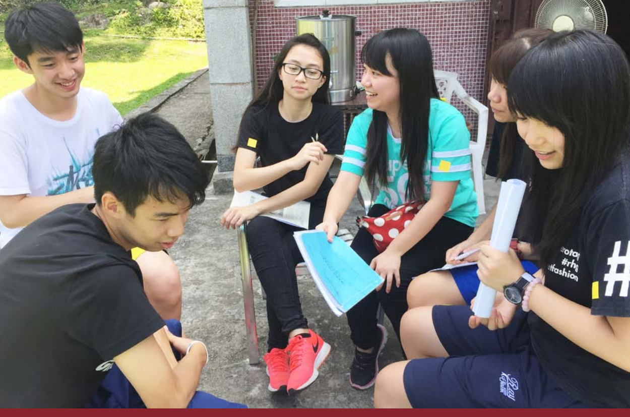
协办澳门教育暨青年局2015年暑期活动—“新思维义工培训营”的参加者小组讨论