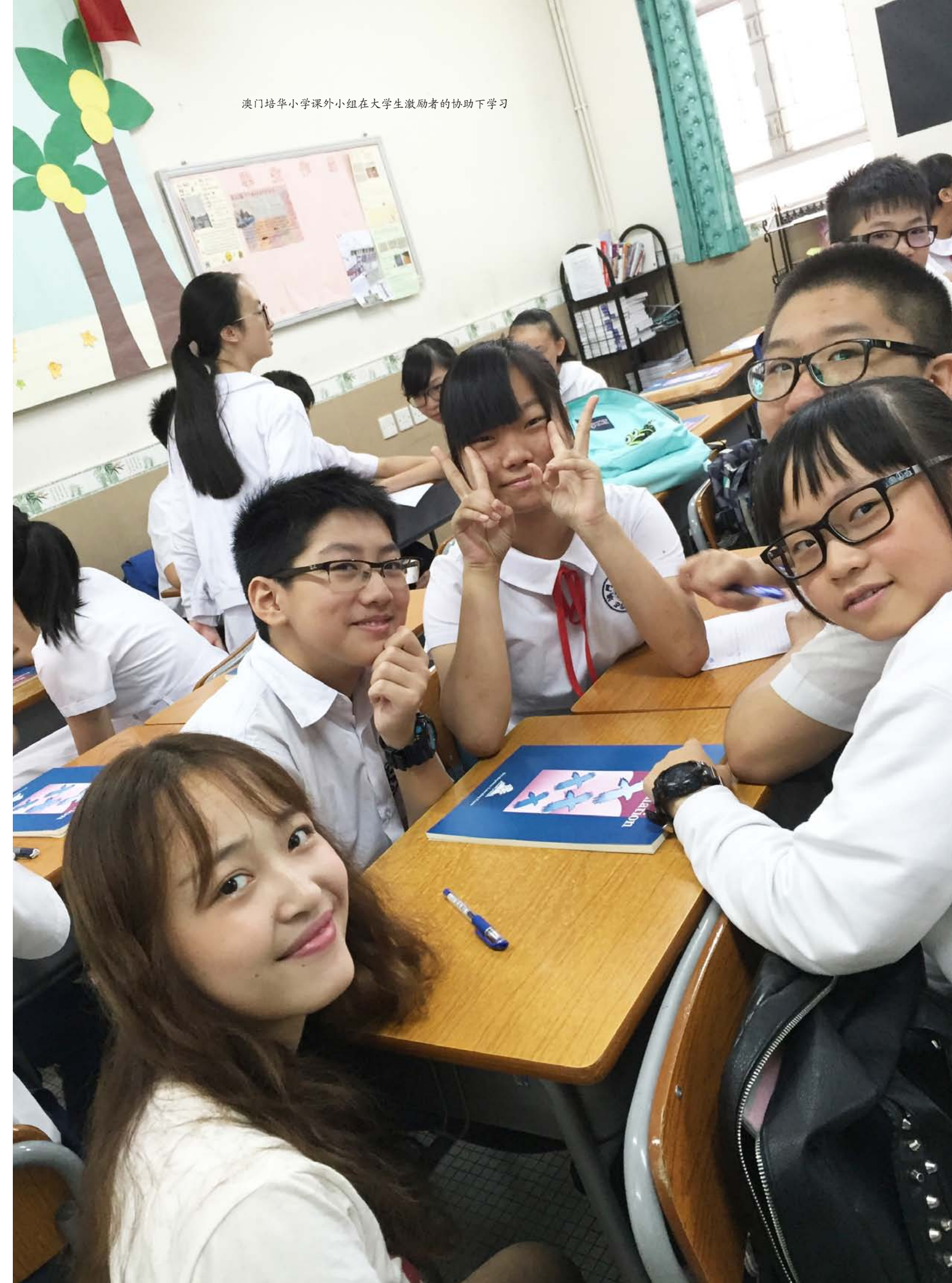
澳门培华小学课外小组在大学生激励者的协助下学习