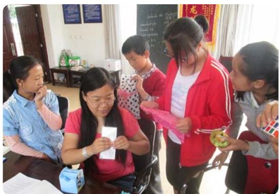
云南丽江的激励者和青少年们一起开展艺术活动

在云南大理，参与这一项目的青少年们逐渐开始通过故事理解生活的目标以及教育的双重目的等抽象的概念，也积极计划并组织了包括清理社区，照顾孤寡老人等诸多社区服务活动。值得一提的是在该机构初创时参与项目的青少年目前已经升入大学，他们依旧利用自己的假期时间参与到该项目的协助学习中，这也是该项目培养社区自身人力资源的重要体现之一。在广东汕头，同样有10年前参与过项目的青少年目前已经大学毕业，她们不仅积极投身于公益领域的工作，同时也成为这一项目在当地的激励者。