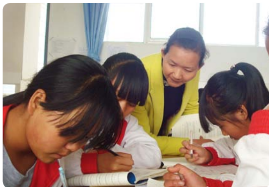
云南大理的激励者正在协助青少年学习