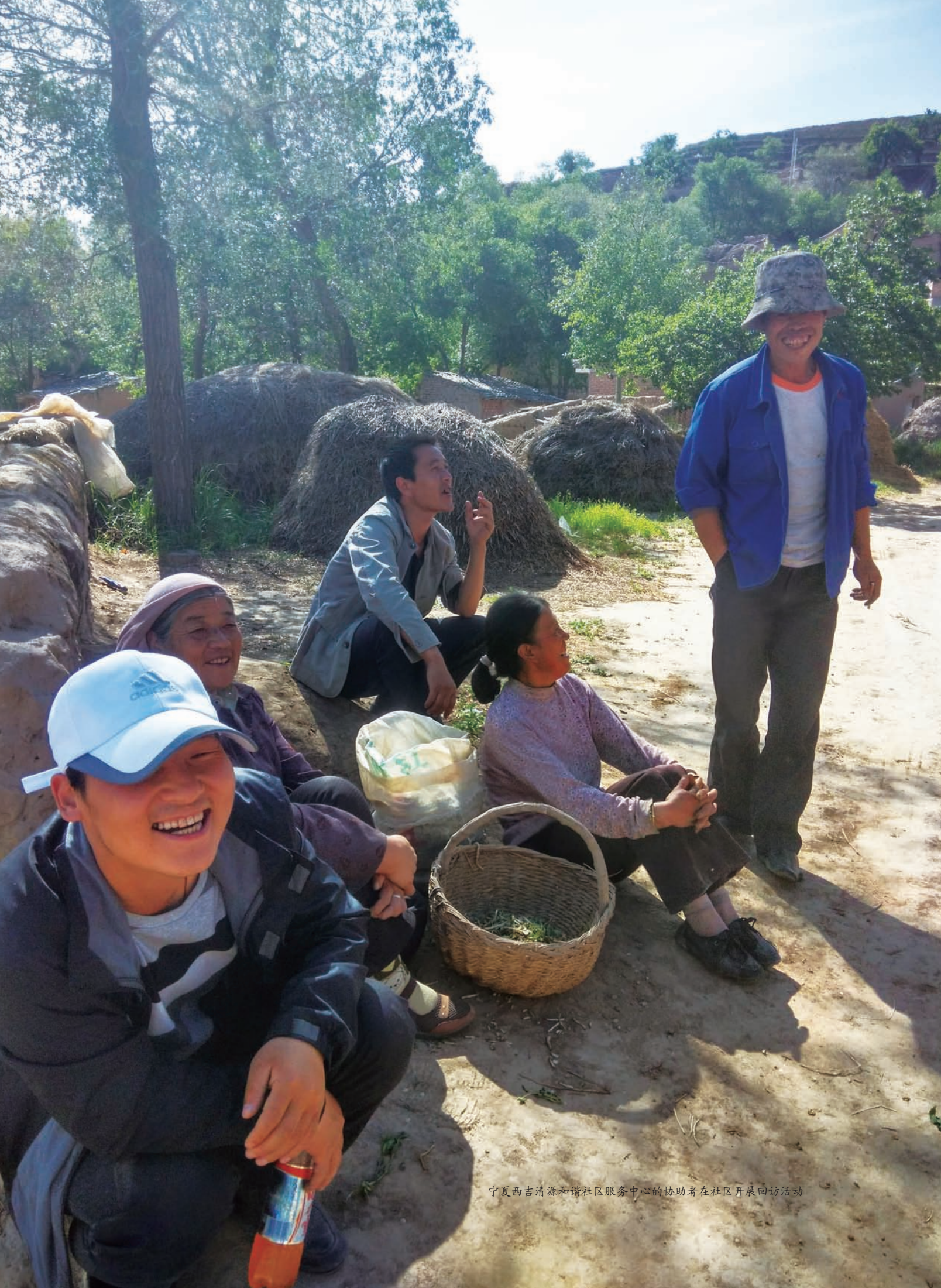
宁夏西吉清源和谐社区服务中心的协助者在社区开展回访活动