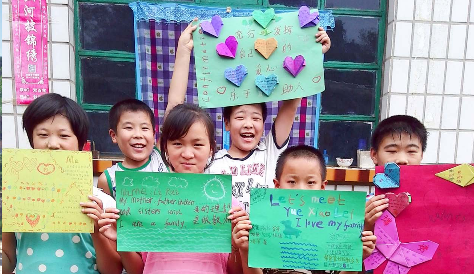
河北武邑春风青少年能力发展中心的项目参加者展示他们自己的艺术活动作品