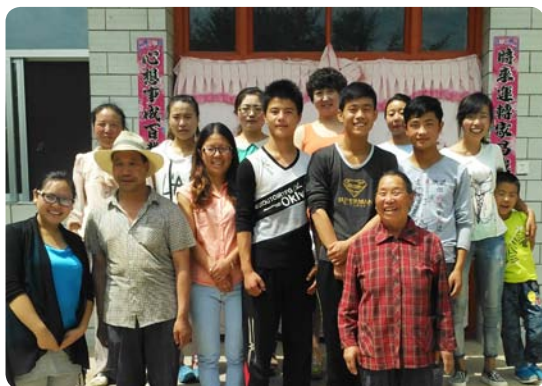
甘肃临洮的激励者和巴迪基金会职员共同开展青少年家访活动