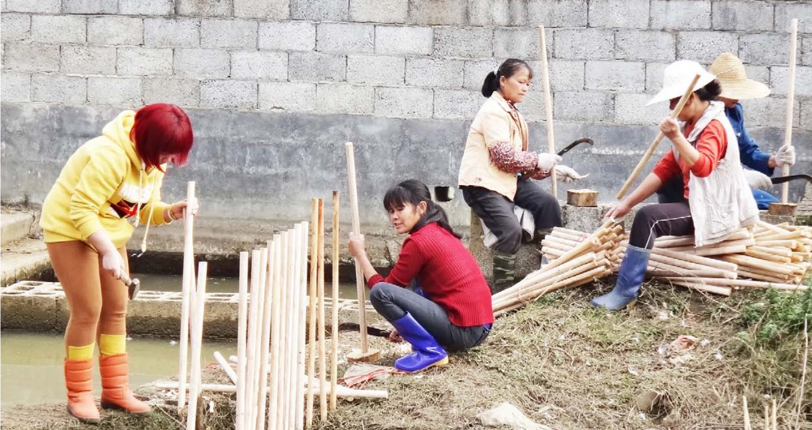
广西德保贝侬家园社区服务中心的项目参加者为社区水池加上护栏