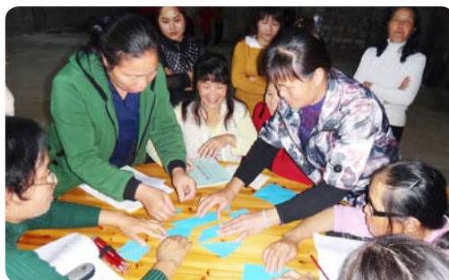
广西德保的项目参加者们通过游戏学习科学知识