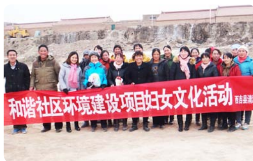
宁夏西吉的项目参加者们自发组织了不同文化活动