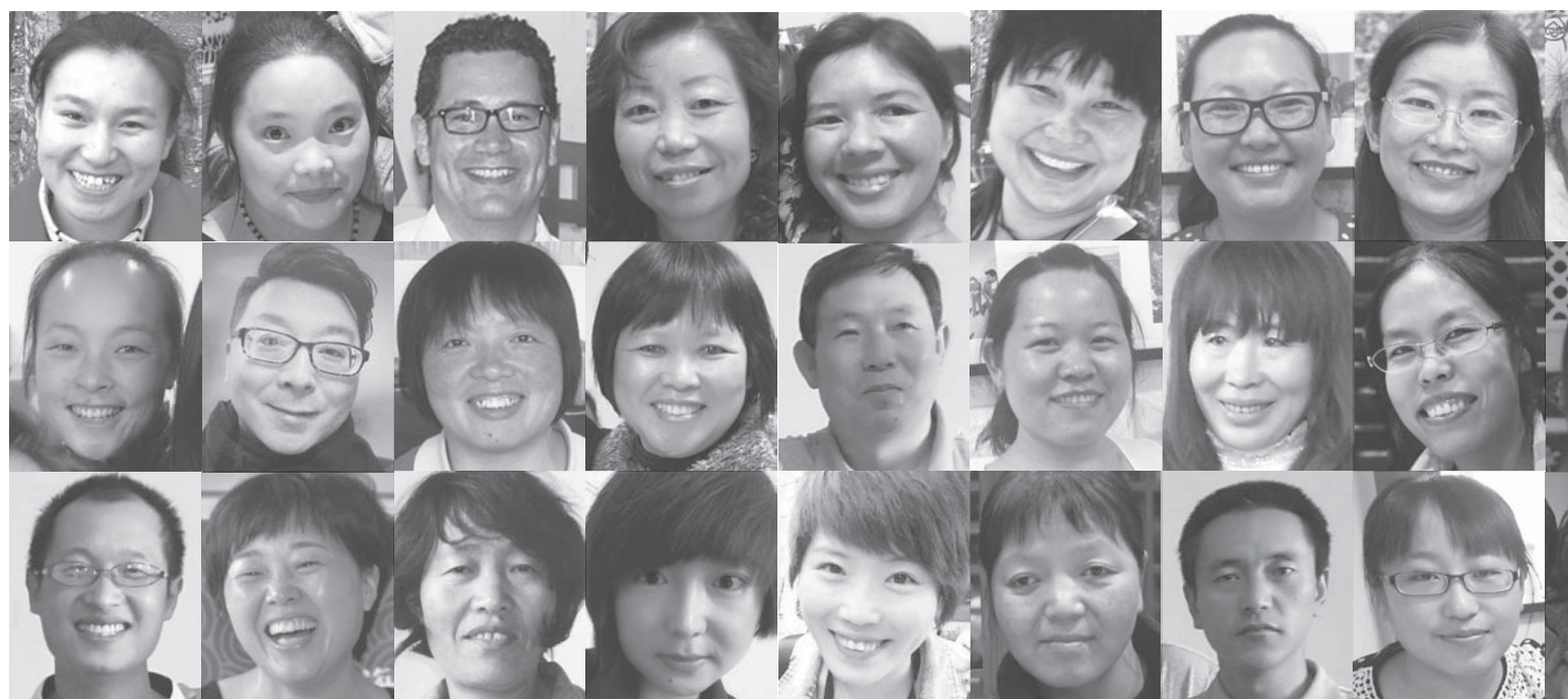
巴迪基金会职员及基层社区合作伙伴