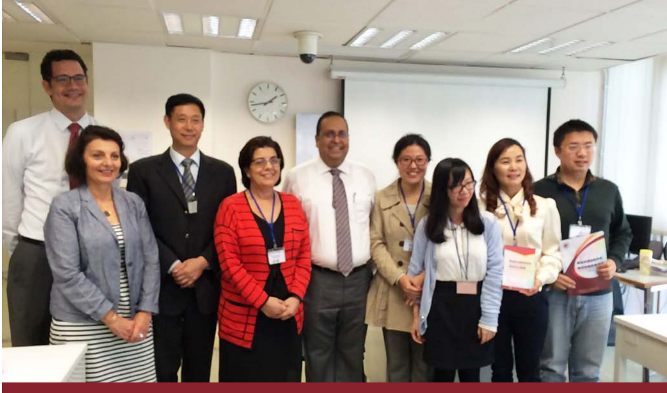
深圳南山艺术与科学实验学校到访联合国学校