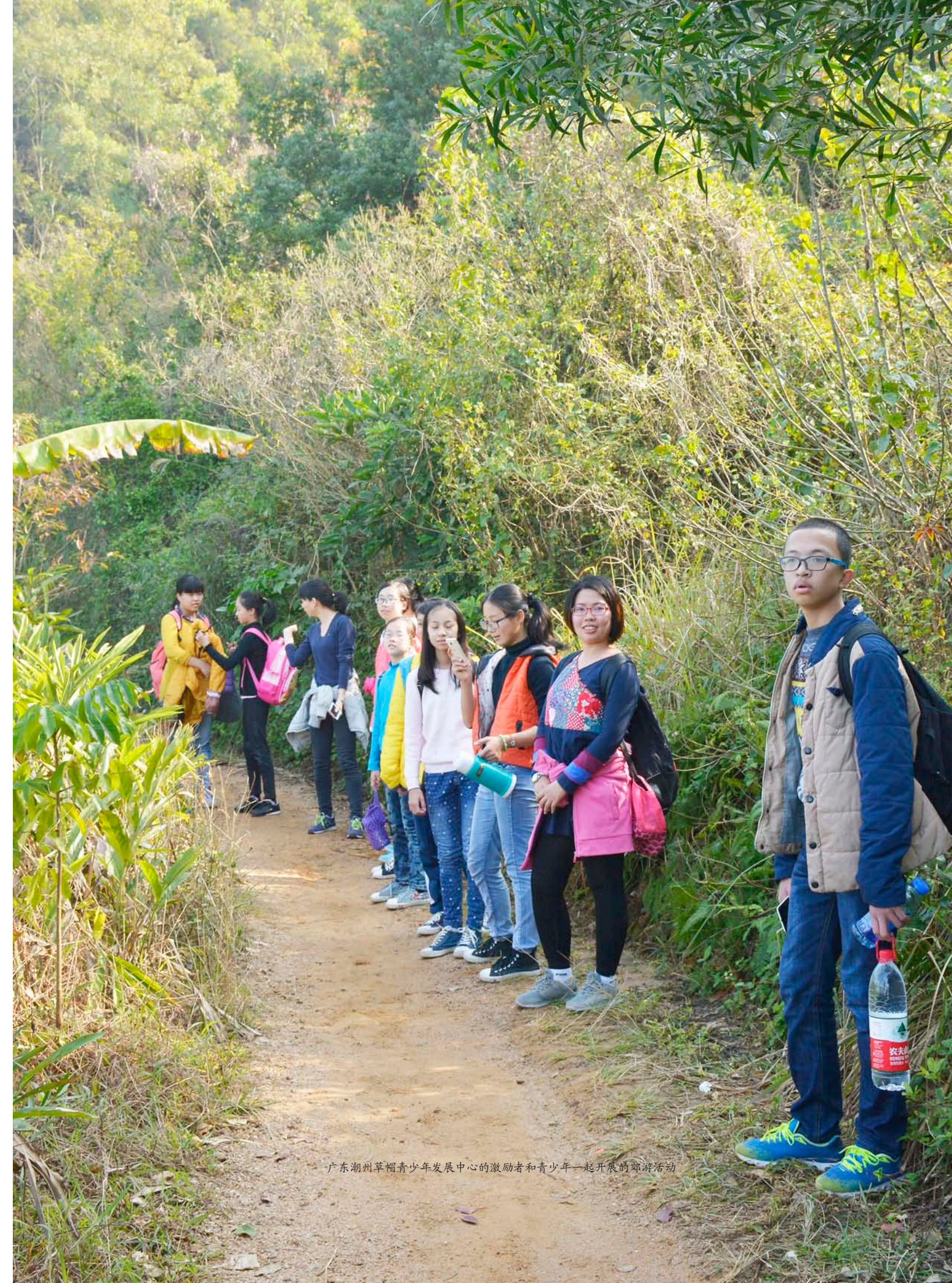
广东潮州草帽青少年发展中心的激励者和青少年一起开展的郊游活动