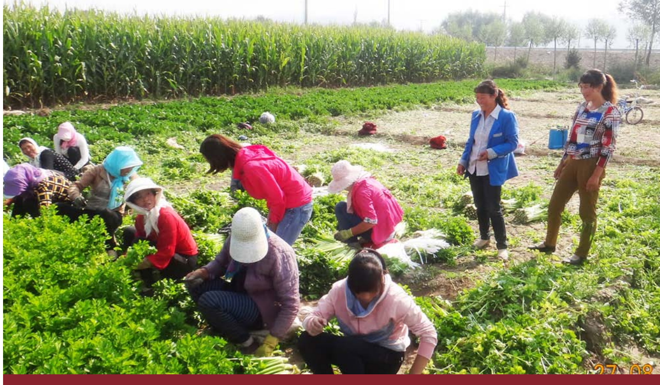
宁夏西吉清源和谐社区服务中心的项目参加者们自发组织的农业生产互助小组