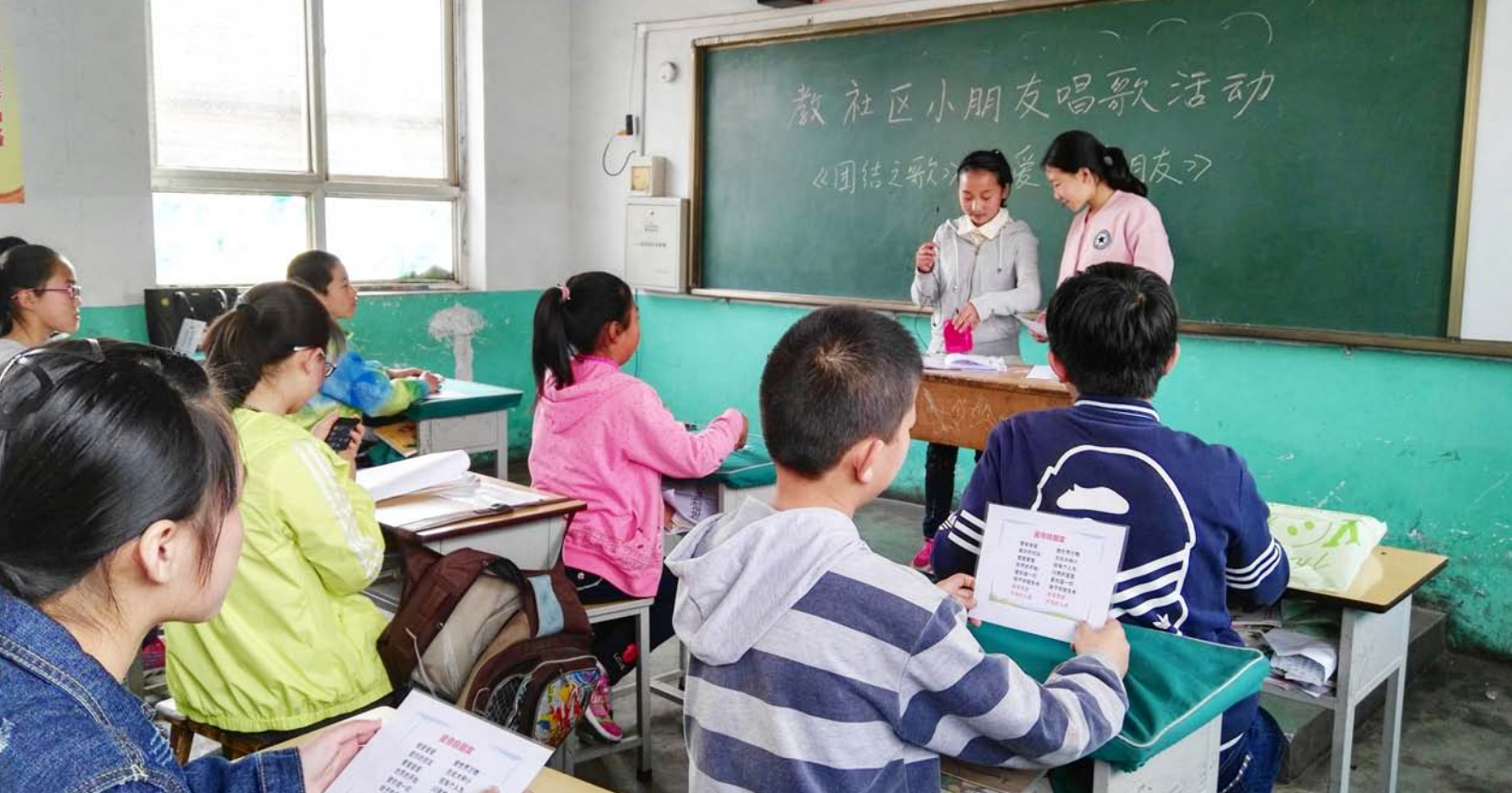
山西泽州新园青少年赋能发展中心的项目参加者自发组织的教社区小朋友唱歌活动