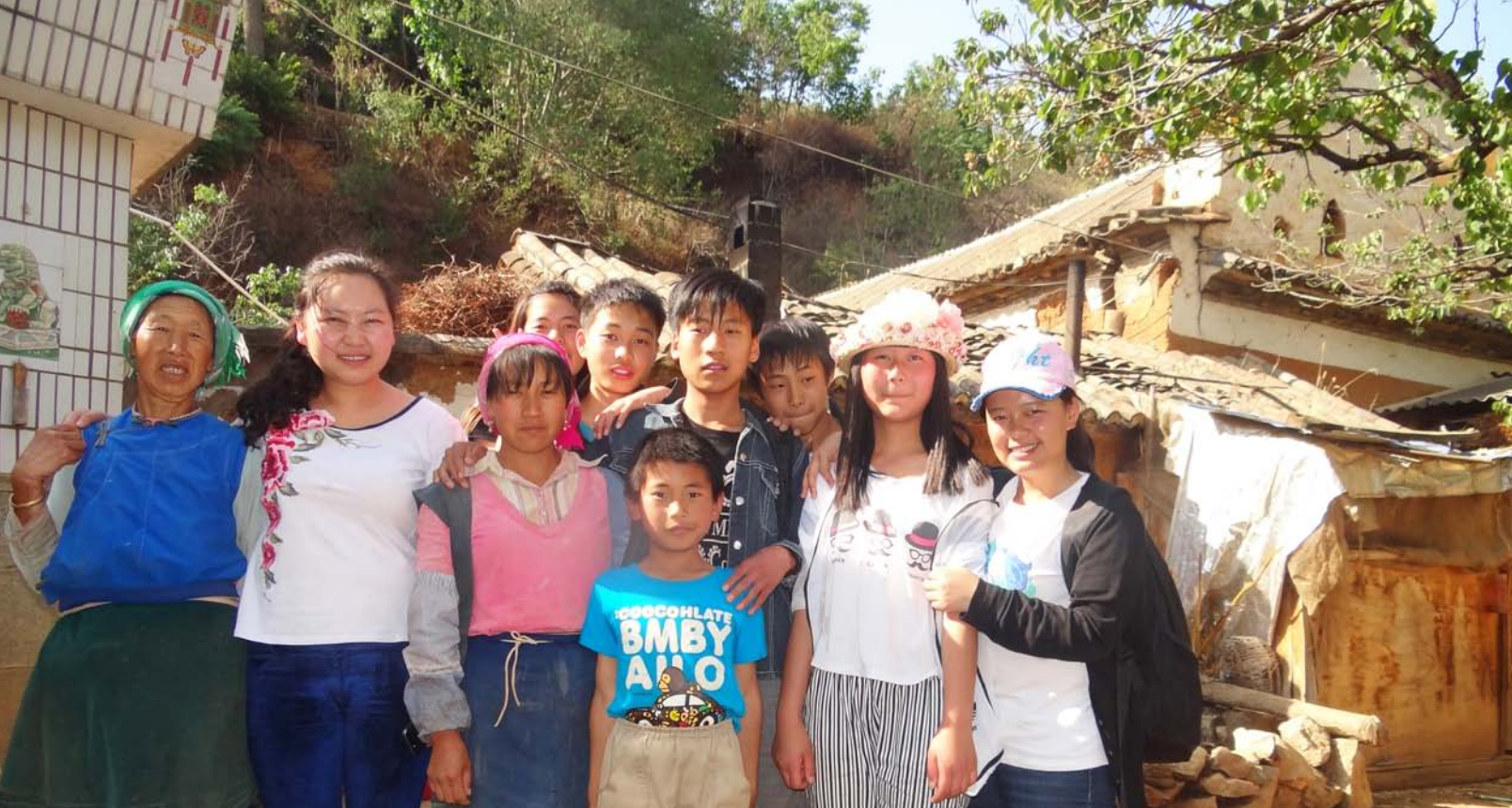
云南大理明惠青少年赋能教育中心的激励者和巴迪基金会职员一起开展社区回访活动