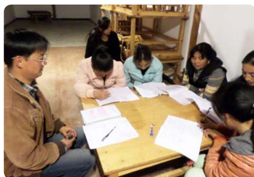
云南丽江的项目参加者们正在学习环境建设项目教材